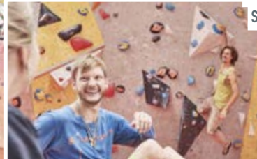
Slackline & Spielplatz