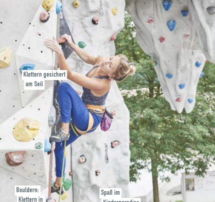
Klettern gesichert am Seil