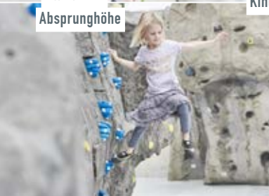
Bouldern: Klettern in Absprunghöhe